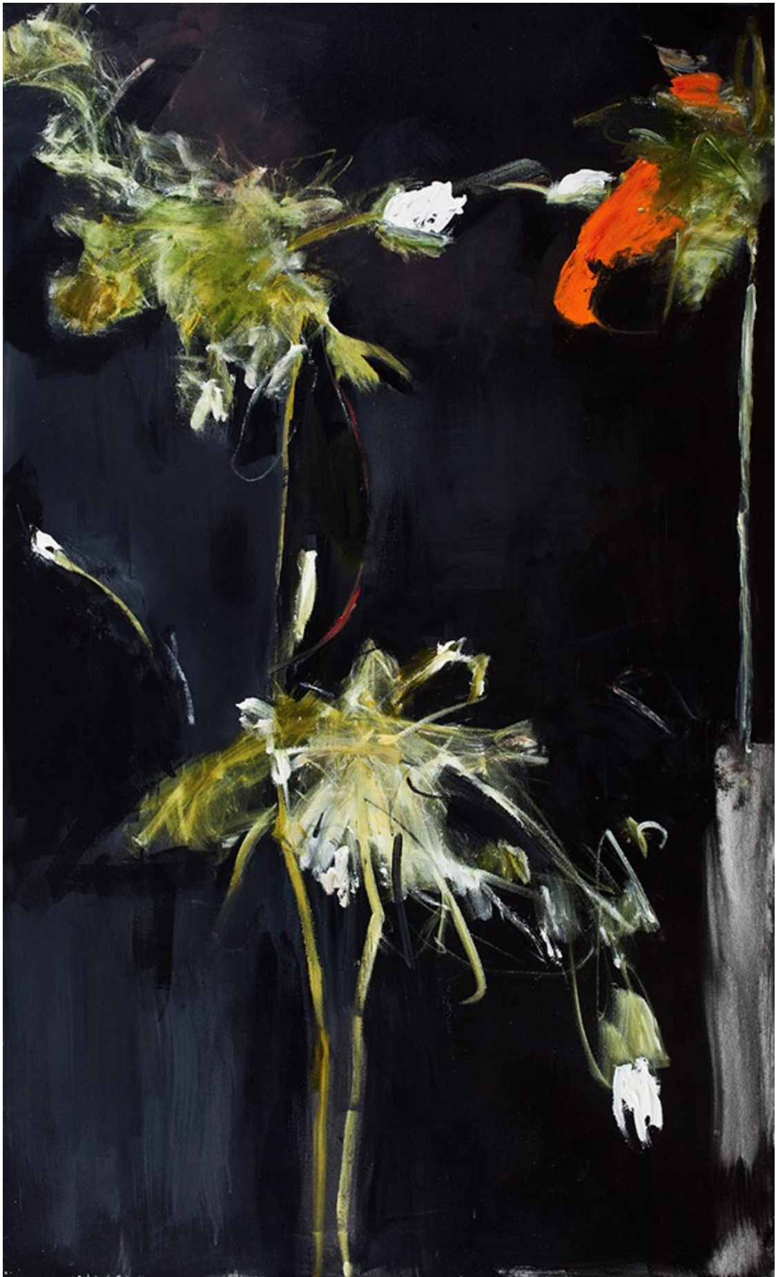
Orange Flower, Green Stem, Serie Follaje en la Oscuridad, 2007 © Farideh Lashai