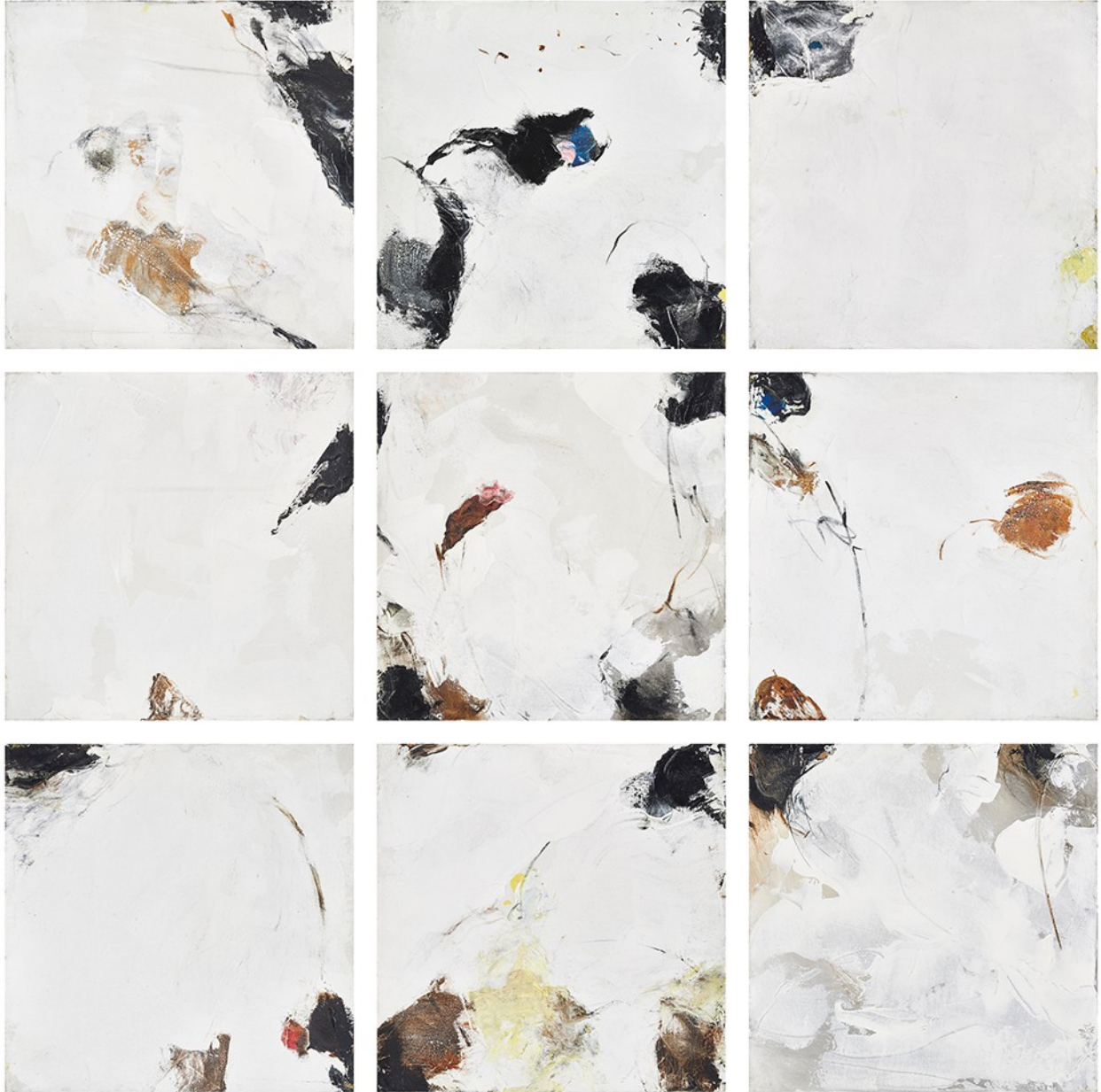
Cypress Trees, Serie Árboles Cipreses, 2007 © Farideh Lashai