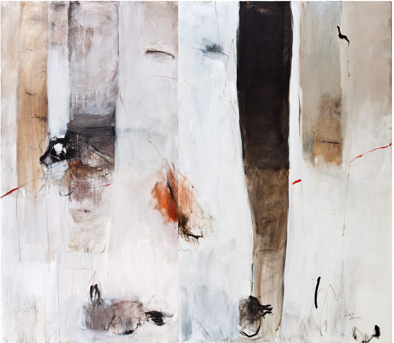
Untitled, Serie Granadas y Árboles, 2008 © Farideh Lashai