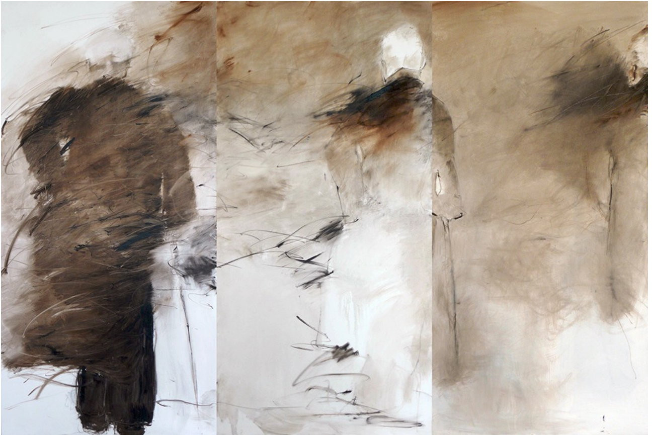
Untitled, Serie Mossadegh, 2008 © Farideh Lashai